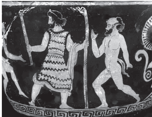
Fig. 100 (p.c. 36)

Prometeo (con antorchas, que representan el fuego) y sátiros a su alrededor.