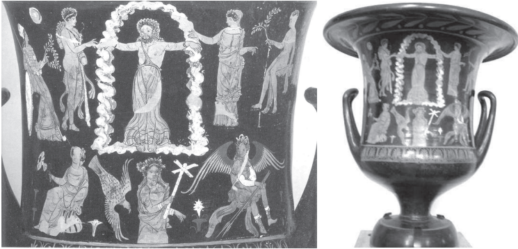
Prometeo y Heracles

Cratera apulia de fig. rojas. Ca. 350 a.C. Berlin, Staatliche Museen Antikensammlung 1969.9.