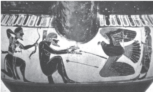
Fig. 98 (p.c. 35)

Prometeo y Heracles, que está matando al águila Cratera con columnas ática de fig. negras. Ca. 560-550 a.C. Berlin, Staatliche Museen Antikensammlung F 1722.