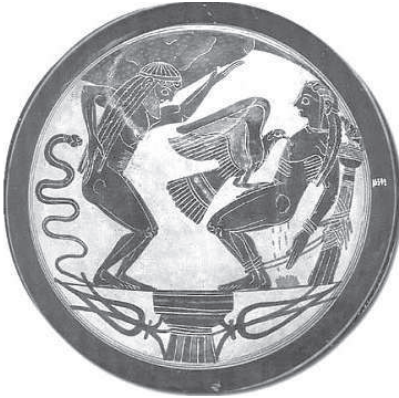
Fig. 94 (p.c. 34)

Castigos de Prometeo y de Atlas. Copa laconia de fig. negras del pintor Arquesilas. Ca. 565-550 a.C. Vaticano, Museo Gregoriano Etrusco 16592.