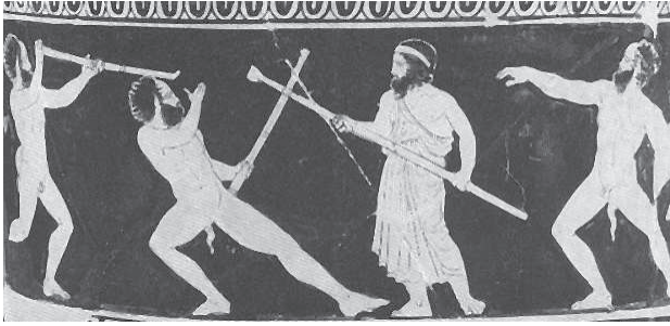
Prometeo y sátiros

Cratera de fig. rojas. Ca. 420-410 a.C. Oxford, Ashmolean Museum.